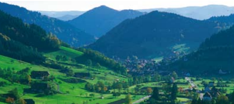
Das Wolfstal bietet klassische Schwarzwaldimpressionen