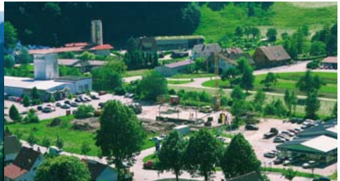
Blick auf das Gewerbegebiet