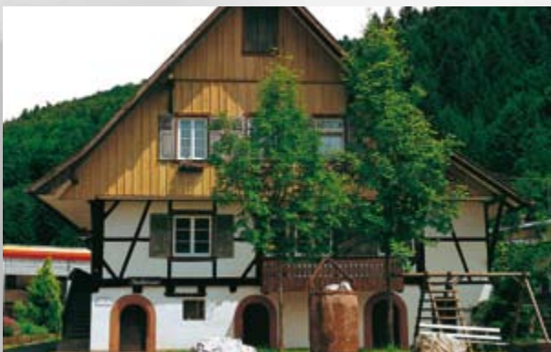
Bergbau- und Mineralienmuseum im historischen Hofbauerhaus