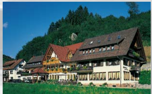
Eines von mehreren guten Hotels- und Gasthäusern