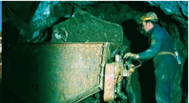
Arbeit unter Tage in der „Grube Clara“