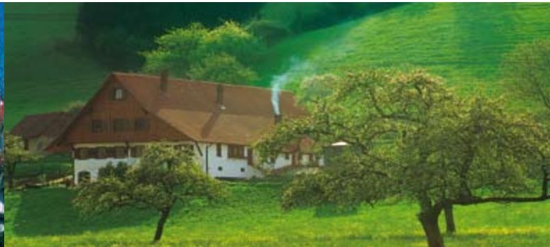
Weiler und Einzelhöfe prägen die Gemeinde Oberwolfach