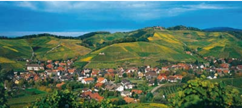
Panoramablick über Durbach