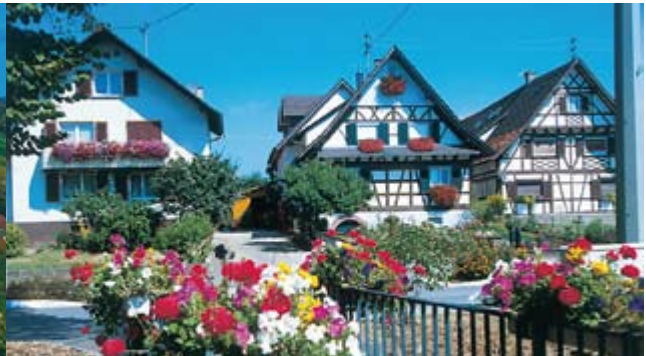
Fachwerk in Ebersweier