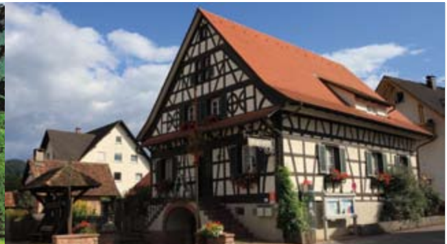
Wein- und Heimatmuseum