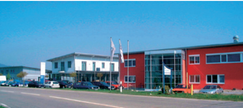
Verkehrsgünstig gelegene Gewerbeflächen