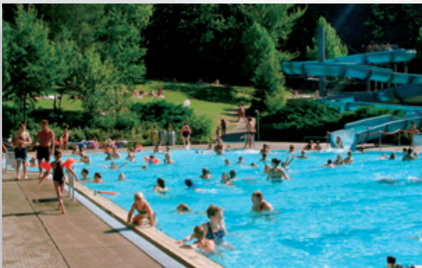
Waldterrassenbad in Biberach