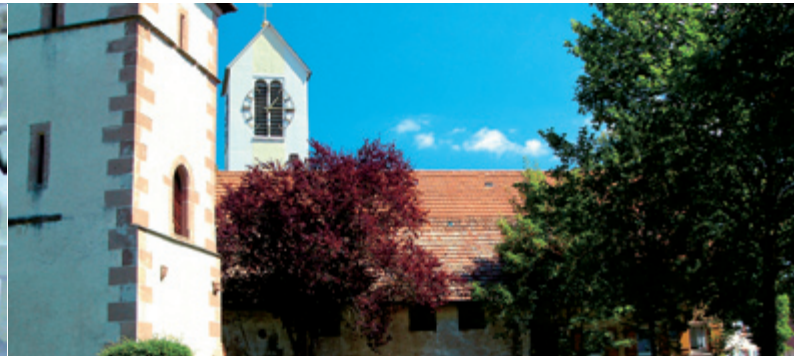
Die alte und neue Kirche von Biberach