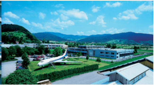
Flugzeug-Hebetechnik von Hydro